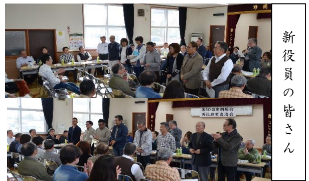
新役員 の 皆 さ ん