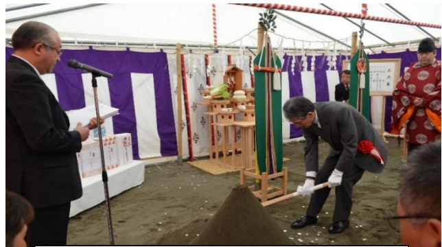
4月26日地鎮祭が執り行われました