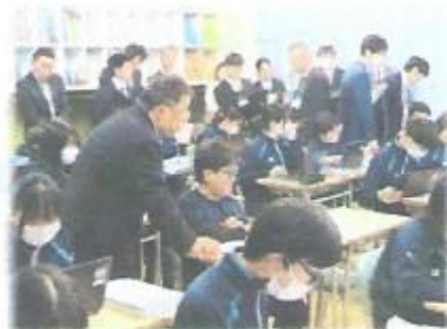
研究発表会の特設授業の様子

石狩管内教育研究会と江別市教育研究会の指定を受けて3か年の研究実践を積み上げてきた中央中学校が、10月27日(金)に研究発表会を開催し、その成果を広く石狩管内の先生方に発表しました。その際、中央中学校区の対雁小と中央小の2校は、先生方が全員で参加し、授業参観と研究協議を通して対話やICTの活用を取り入れた授業改善等についての研修を深めました。