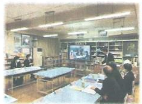
2回目の第二中学校区学校運営委員会