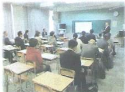
はじめての4校合同学校運営委員会

10月18日(水)の市内小・中学校の「学校一斉公開」に合わせて、野幌中学校区の4校(野幌中、野幌小、東野幌小、野幌若葉小)が「えべつ型コミュニティ・スクール」の学校運営委員会を合同で開催しました。野幌中学校区の小中一貫教育推進体制の中の「CS・PTA・教育環境整備部会」が企画し、普段は別々に活動している4校の学校運営委員が初めて一堂に会し、交流を行いました。学校運営委員の前には、可能な限り中学校区内の他校の学校視察も行い、子どもたちの様子や校内環境、授業の様子等を把握していただいた上で熟議を行いました。