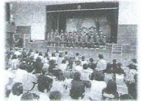
中学3年生のきれいな歌声

今回の中学校登校は、小中の先生方で組織する「児童生徒交流部会」が企画し、昨年度の実践の内容を変更して実