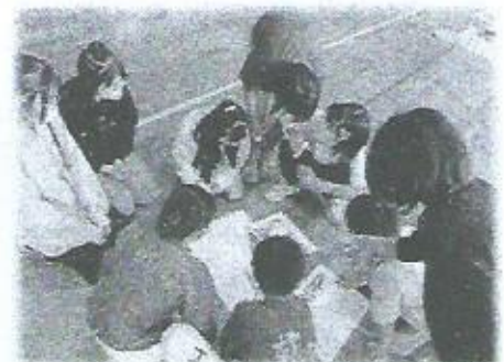
友だちと対話しながらの作業