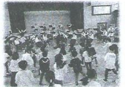
吹奏楽部のふれあいコンサート