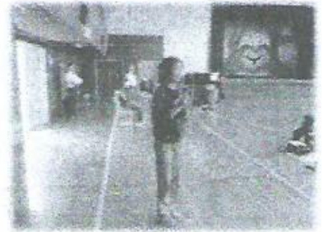
小学生の素晴らしい感想発表