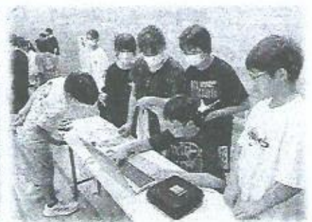
情報大学と連携した プログラミング学習 (東野幌小)