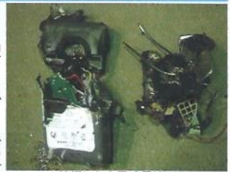
↑ 焼損した充電式電池