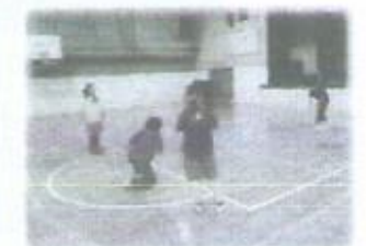
特別支援学級の合同学習