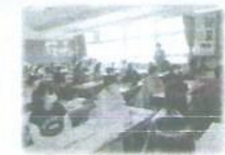
江別太小と豊幌小が合同学習