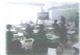
修学旅行発表会の中3生徒と小6児童の発表