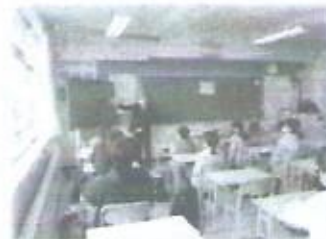
中学校の先生による朝の会

今回の中学校登校で合同学習を行った中学3年生と小学6年生は、昨年度の新体カテストの際と一緒に活動しており、その時のつながりも感じながら学習をしていたように思います。また、6年生の子どもたちや小学校の先生が修学旅行発表会に参加することで、9