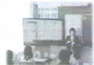
数学科の授業体験 小学校の先生も教えてくれました