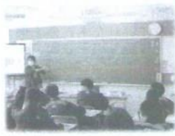
小学校6年生の担任の先生による中学1年生への乗り入れ授業～（左から）美術科・音楽科・数学科～