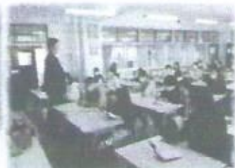
中学校の校長先生のお話