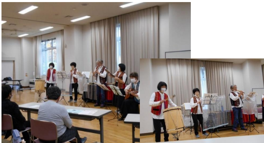
ウィラコチャの皆さん