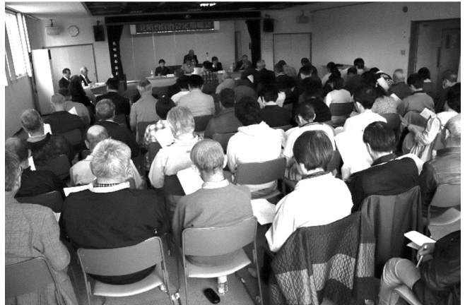
昨年度の自治会総会