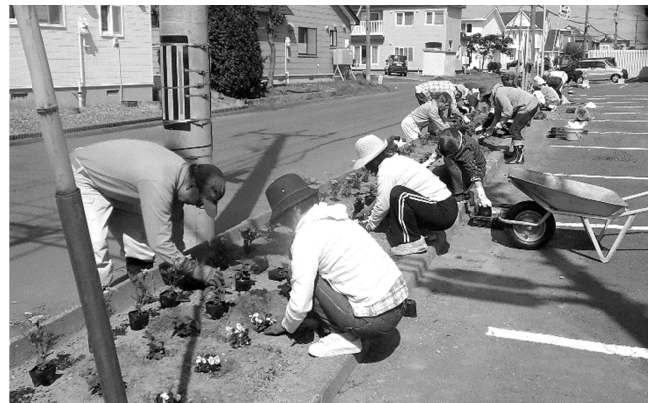
昨年度の花壇造成