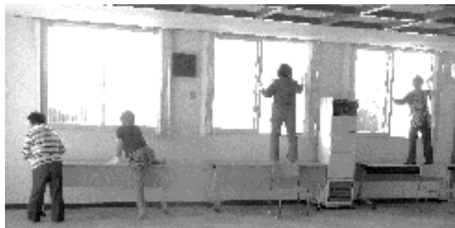
[生活環境部・事務局]