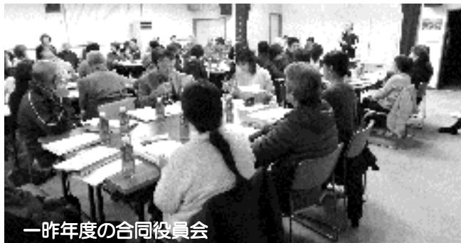
一昨年度の合同役員会

5月18日(土)午後7時から、 新班長さんを含め全役員による合同役員会 を自治会館において開催します。