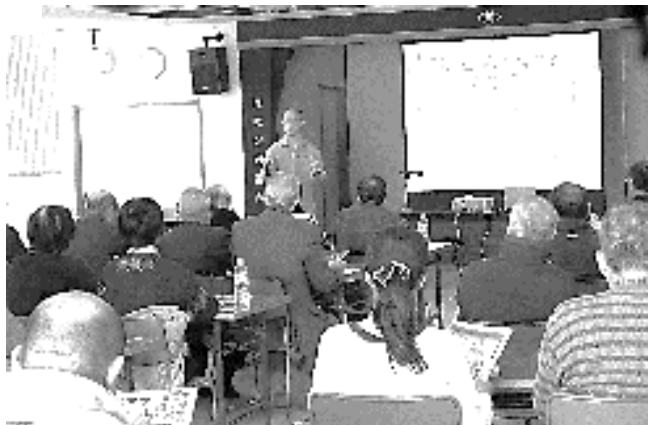
平成29年度防災研修会

市役所では、昨年の地震の後、避難所の運営など様々な課題について検討を行っており、その内容などを担当者から直接聞く機会を設け