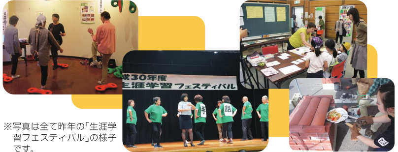
※写真は全て昨年の「生涯学習フェスティバル」の様子です。