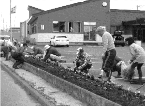
自治会館駐車場花壇花苗移植