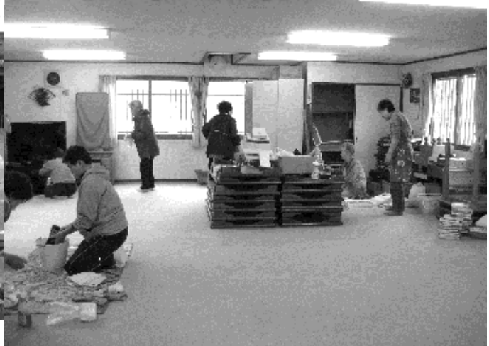
ふれあい会館内の清掃

5月27日(日)、天候にも恵まれて93名の会員の参加があり、自治会館花壇の花苗植え付けと自治会館・ふれあい会館の清掃が行われました。