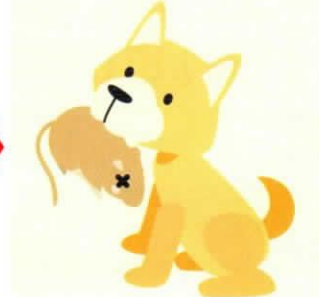
キツネと同じく、犬も野ネズミを食べて感染します。