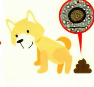
感染犬の糞が人への感染源となります。