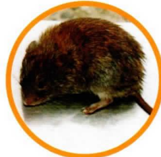
エゾヤチネズミ (体長10cm程度の小型のネズミです)