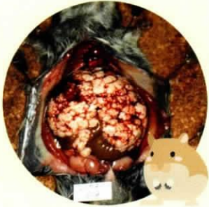
肝臓にエキノコックスが寄生した野ネズミ