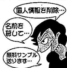
「消費者庁イラスト集より」