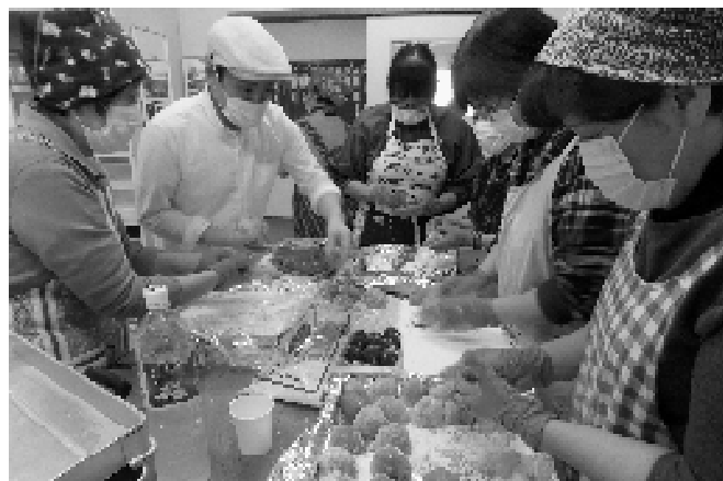
三世代餅つき会（平成30年）

なお、利用の際は予約が必要ですので、自治会館（TEL 385-2063）へ事前にご連絡ください。 〔事務局〕