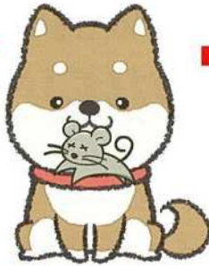
キツネと同じく、犬も野ネズミを食べて感染します。