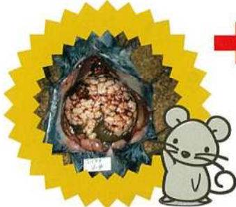
肝臓にエキノコックスが寄生した野ネズミ