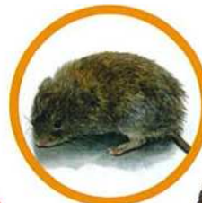
エソヤチネズミ 体長10cm程度の小型のネズミです